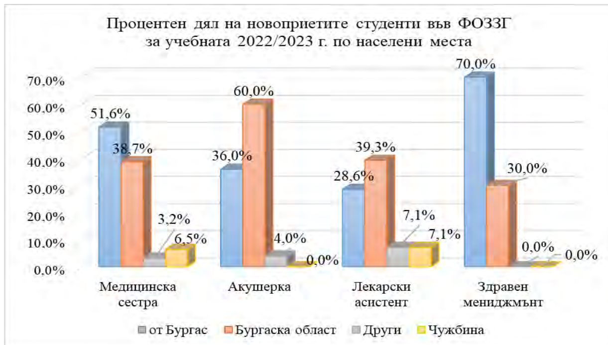
Фиг. 1 Процентен дял по населени места на първокурсниците ОКС „Бакалавър“ по населени места за учебната 2022/2023 г., ФОЗЗГ

Процентният дял на първокурсниците от град Бургас, от населени места в Бургаска област и от други населени места по четирите обучавани специалности в ОКС „Бакалавър“ е представен на Фиг.1.