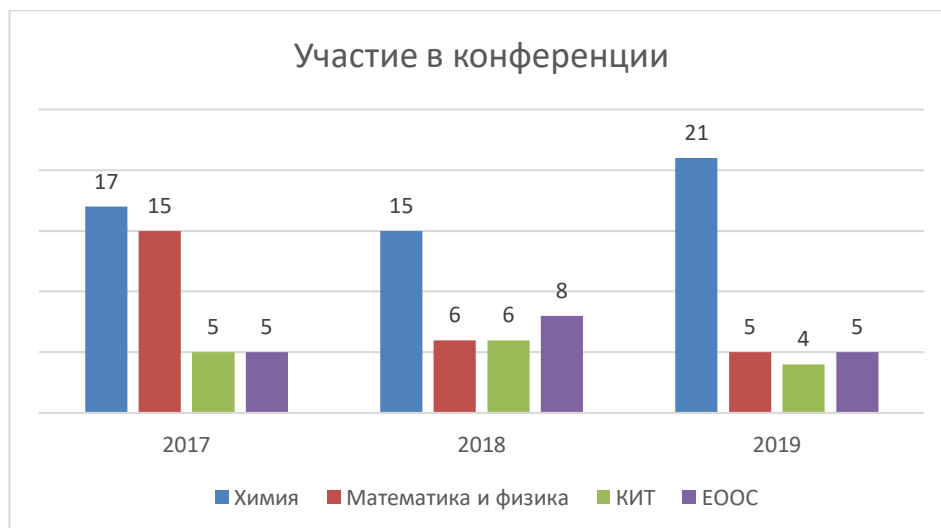
Фиг. 3 Участие в научни конференции (национални и международни)

В рамките на отчетния период общия брой участия в конференции е 112 (Фиг. 3).